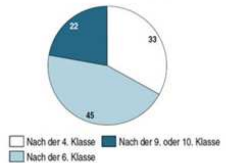
Selektion in der Schullaufbahn [%]

Schwarzrotgrüngebe Politiker stellen sich taub. Sie bauen das Zwei-Klassen Schulsystem.