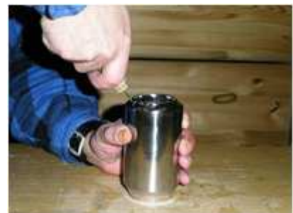
Abb. 3: Anfertigen der Düsenlöcher

Als nächstes wird an einer Dose der Boden am Rand mit kleinen Löchern versehen die später als "Düsen" fungieren sollen. Hierfür benutze ich eine etwas stärkere Nähnadel die ich mir in einen Holzgriff eingeklebt habe. Die Nadel muss aber nicht unbedingt einen Handgriff aufweisen sie kann auch mit einer Zange festgehalten werden (ist halt nur ein wenig umständlicher).