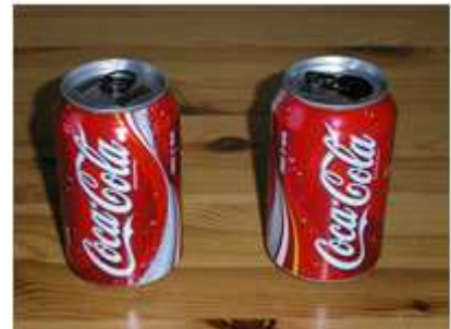
Abb. 1: Für den hier beschriebenen Spirituskocher benötigt man leere Getränkedosen

Die leeren Dosen werden nun zuerst mit Schleifpapier von der aufgedruckten Farbe befreit. Sollte es jedoch mal schnell gehen, kann man diesen Arbeitsschritt aber getrost überspringen. Ich für meinen Teil bevorzuge jedoch die Dosen, die schön blank geschmirgelt wurden :-)