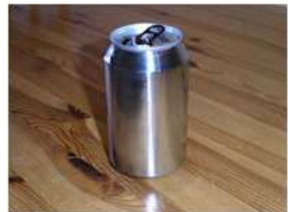
Abb. 2: von der Farbe befreite Getränkedose