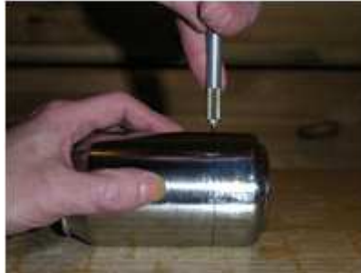
Abb. 4: Dosenboden entfernen - Brenneröffnung